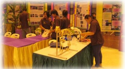
นิทรรศการจัดแสดงโปสเตอร์ให้ความรู้ทาง วิทยาศาสตร์และตัวอย่างพืชและสัตว์ โดยภาควิชาเกษตรและทรัพยากร