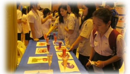
ทดลองชิมไวน์ผลไม้ชนิดต่างๆ พร้อมตอบปัญหา ลุ้นรับของรางวัลและของที่ระลึก โดยภาควิชาเทคโนโลยีการอาหารและโภชนาการ