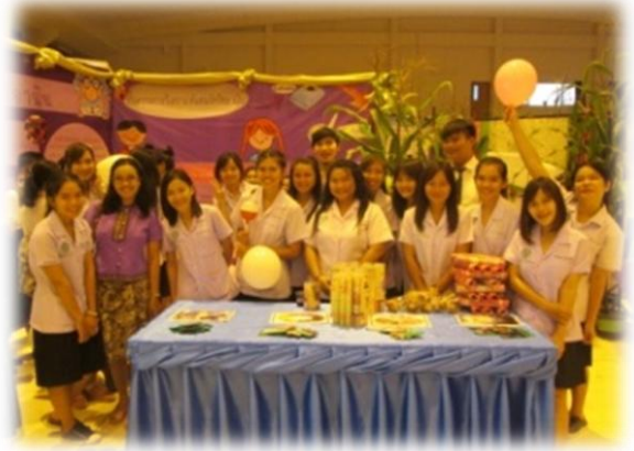
บรรยากาศการทำกิจกรรมของคณะอาจารย์ และนิสิต คณะ ทอ. ภาควิชาเกษตร และทรัพยากร และภาควิชาเทคโนโลยีการอาหารและโภชนาการ

กิจกรรมงานวันวิทยาศาสตร์ ครั้งที่ 13 ประจำปี 2558 : เมื่อวันที่ 18-19 สิงหาคม 2558 มหาวิทยาลัยเกษตรศาสตร์ วิทยาเขตเฉลิมพระเกียรติ จังหวัดสกลนคร จัดงานวันวิทยาศาสตร์ ครั้งที่ 13 ประจำปี 2558 ณ หอประชุมวิโรจ อิมพีทักษ์ อาคารวิทยาเขตเฉลิมพระเกียรติ (อาคาร 14) เพื่อเผยแพร่ความรู้และกระตุ้นการเรียนรู้ด้านวิทยาศาสตร์ให้กับเยาวชน ในจังหวัดสกลนครและจังหวัดใกล้เคียง ในงานดังกล่าว คณะอาจารย์ บุคลากร และนิสิต คณะ ทอ. ได้มีส่วนร่วมในการจัดกิจกรรมหลากหลาย อย่าง เช่น การจัดการแข่งขันประกวดบรรจุภัณฑ์ การจัดนิทรรศการทาง วิทยาศาสตร์ ไม่ว่าจะเป็นการจัดแสดงตัวอย่างพืช สัตว์ โปสเตอร์ให้ความรู้ทางด้านวิทยาศาสตร์ รวมทั้งมีการสาธิตทดลองและเล่นเกมส์ตอบ ปัญหาทางวิทยาศาสตร์ โดยมีผู้เข้าร่วมงานจากโรงเรียนต่าง ๆ กว่า 5,000 คน