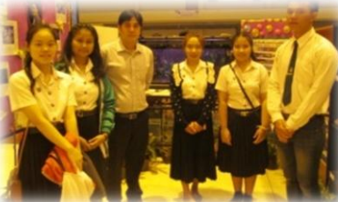
นิทรรศการจัดแสดงตัวอย่างสายพันธุ์ปลา และ ตัวอย่างสัตว์น้ำชนิดต่างๆ โดยภาควิชาเกษตรและ ทรัพยากร สาขาวิชาประมง