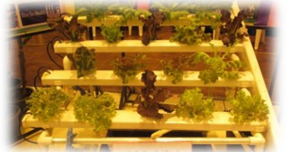
จัดแสดงตัวอย่างการปลูกผักไฮโดรโปนิคส์ (hydroponics) หรือการปลูกผักแบบไร้ดิน โดยภาควิชาเกษตรและทรัพยากร

โครงการค่ายวิทยาศาสตร์และโครงการเปิดการเรียนรู้ในห้องปฏิบัติการ : เป็นงานด้านบริการวิชาการที่ทางคณะทรัพยากรธรรมชาติและอุตสาหกรรมเกษตรร่วมกับคณะวิทยาศาสตร์และวิศวกรรมศาสตร์ จัดขึ้นเพื่อเปิดโอกาสให้น้องๆ นักเรียนระดับมัธยมศึกษาในเขตพื้นที่ภาคตะวันออกเฉียงเหนือได้เข้ามาศึกษาเรียนรู้เกี่ยวกับปฏิบัติการด้านชีววิทยา เคมี ฟิสิกส์ ทั้งในรูปแบบค่าย และไปกลับภายในวันเดียว โดยมีคณาจารย์ และนักวิทยาศาสตร์จากทั้งสองคณะเป็นผู้ให้ความรู้ ซึ่งในช่วงเดือนกรกฎาคม – กันยายน 2558 ที่ผ่านมา ได้มีนักเรียนจากโรงเรียนต่างๆ เข้าร่วมเป็นจำนวนมาก ขอนำตัวอย่างภาพบรรยากาศมาฝากท่านผู้อ่านทุกท่าน ดังนี้ นะคะ