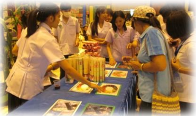
กิจกรรมการเล่นเกมส์ตอบปัญหาทางวิทยาศาสตร์ เพื่อลุ้นรับของรางวัลและของที่ระลึก โดยภาควิชาเกษตรและทรัพยากร