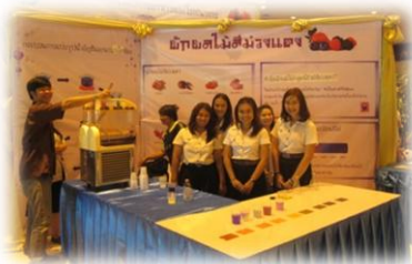
สาธิตการทดสอบค่า pH หลากสี พร้อมตอบปัญหา ลุ้นรับของรางวัลและของที่ระลึก โดยภาควิชาเทคโนโลยีการอาหารและโภชนาการ