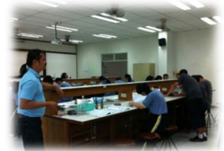
บรรยากาศการเรียนรู้ปฏิบัติการด้านชีววิทยา ของนักเรียนระดับมัธยมศึกษาจากโรงเรียนต่างๆ ที่เข้าร่วมโครงการ