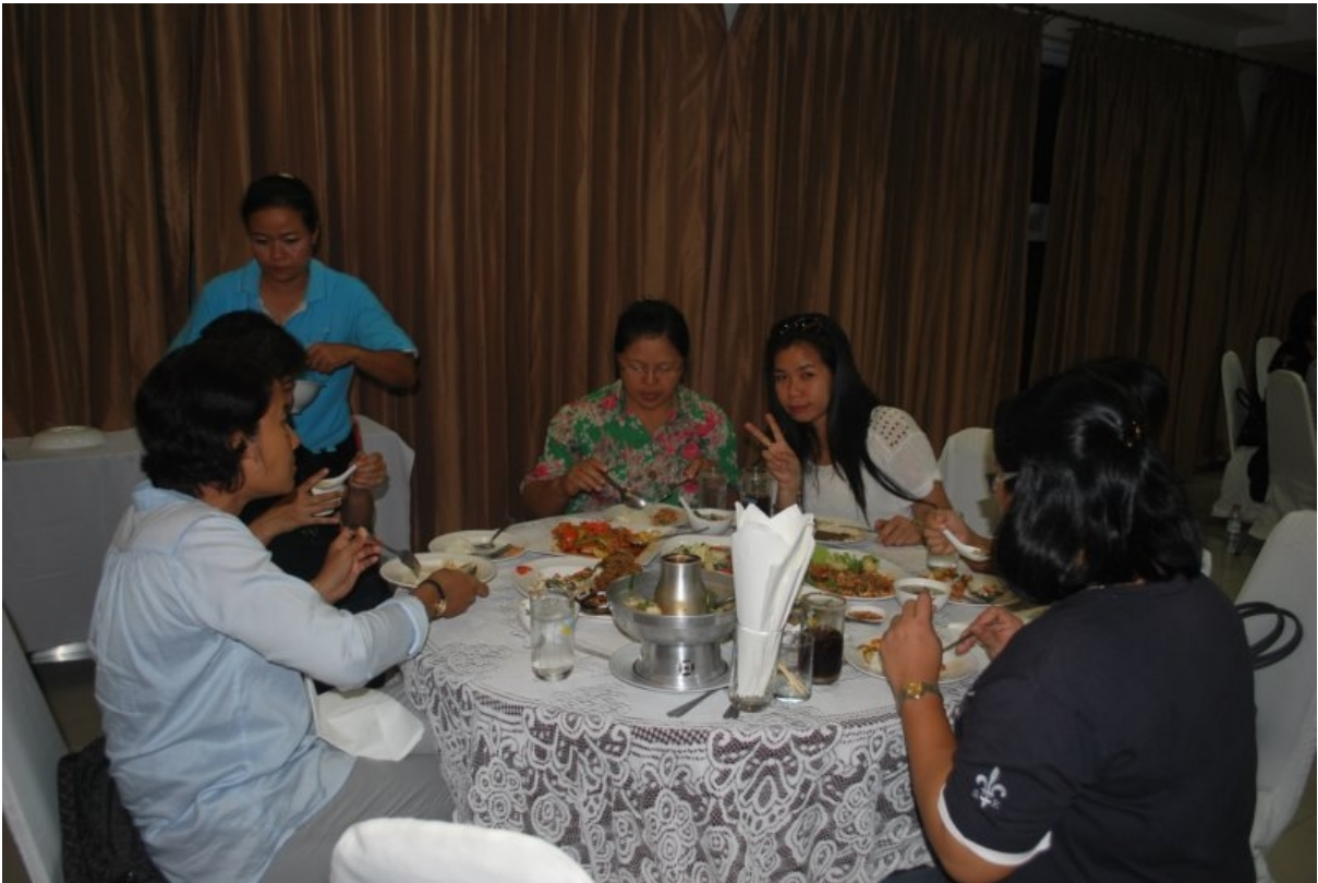
ภาพที่ 12 (บนและล่าง) รับประทานอาหารเย็นร่วมกัน