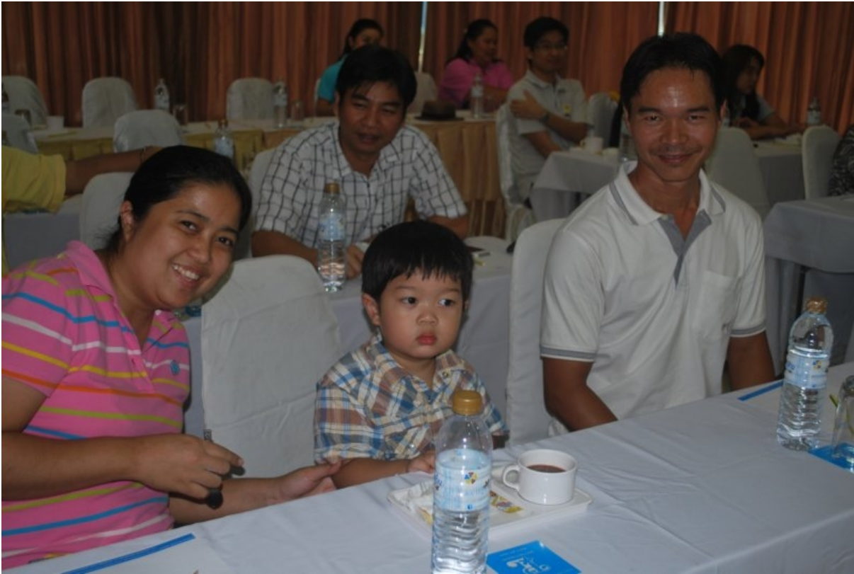
ภาพที่ 3 check in ผู้เข้าสัมมนา