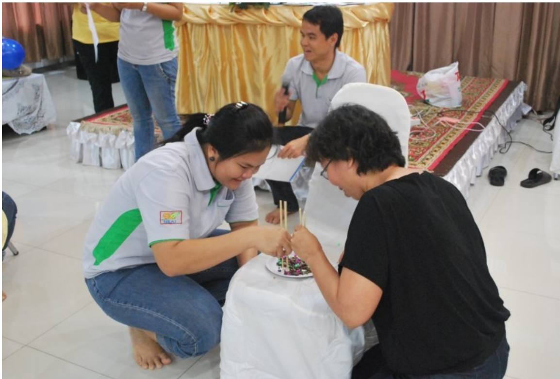
ภาพที่ 9 กิจกรรม team building (คืบ คืบ แยก แยก)