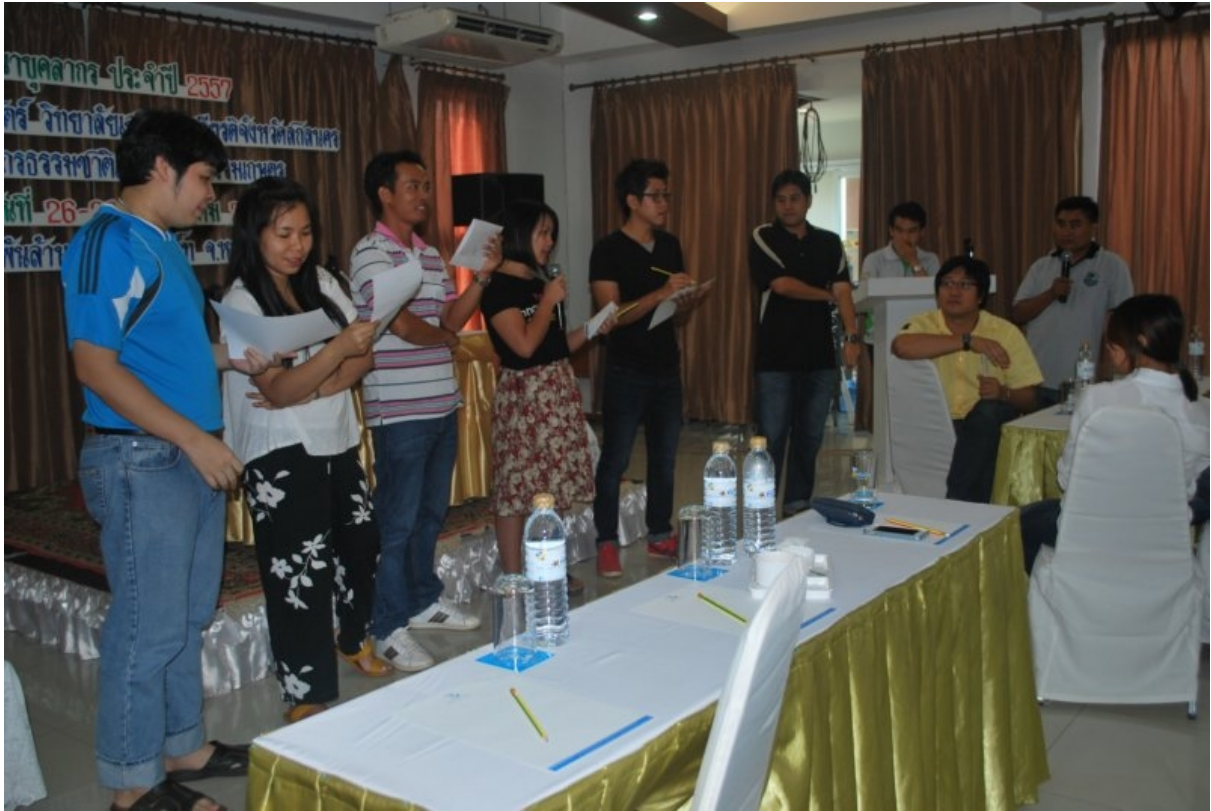
ภาพที่ 7 แต่ละกลุ่มนำเสนอคำสำคัญสำหรับแต่งเพลงคณะ