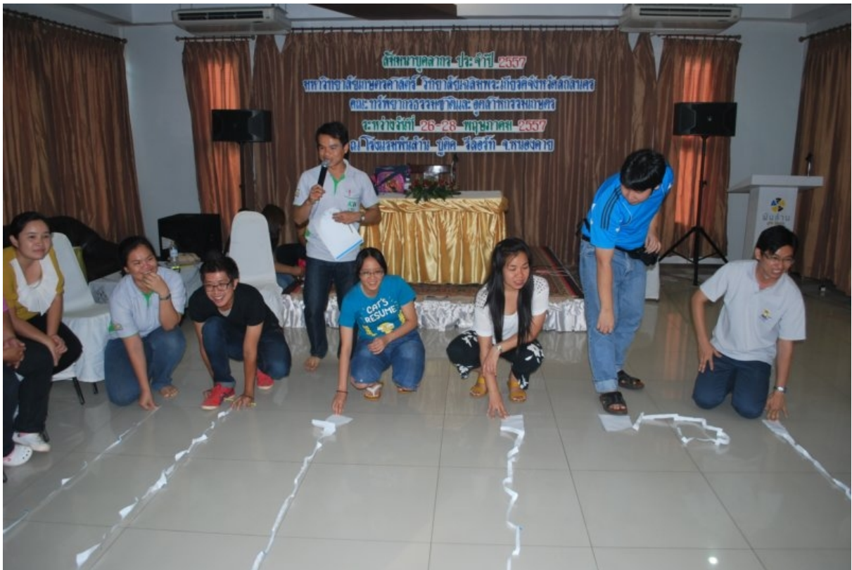
ภาพที่ 8 กิจกรรม team building (กระดาษมัทศจารย์)