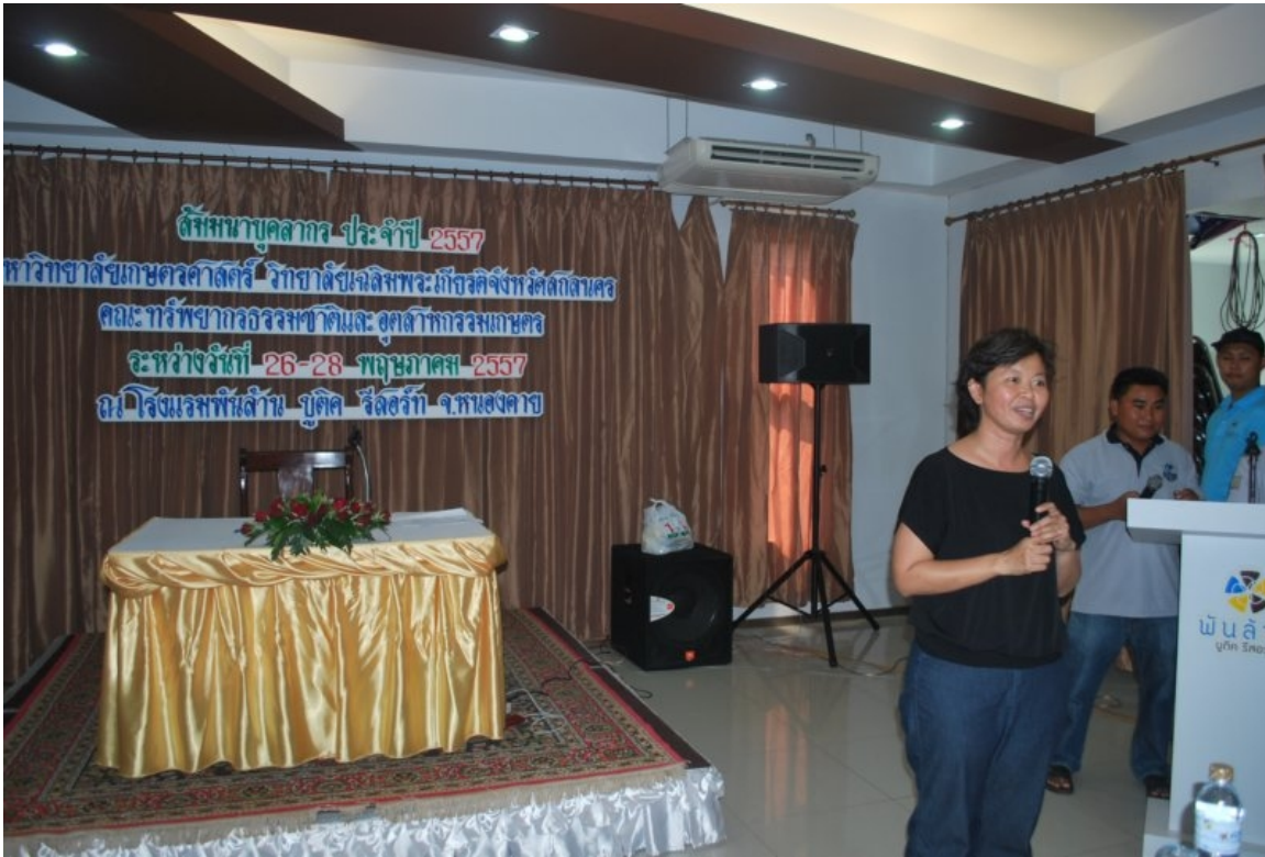
ภาพที่ 1 พิธีเปิดโดยคณบดี