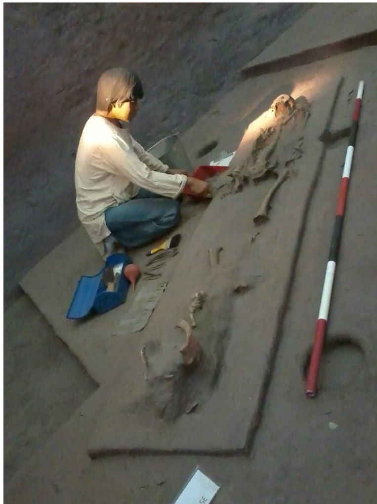
ภาพที่ 14 (บนและล่าง) ณ พิพิธภัณฑ์สถานแห่งชาติบ้านเชียง