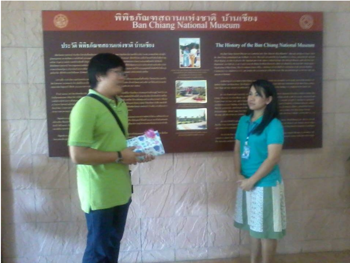
ภาพที่ 14 กล่าวขอบคุณวิทยากรพิพิธภัณฑ์สถานแห่งชาติบ้านเชียง