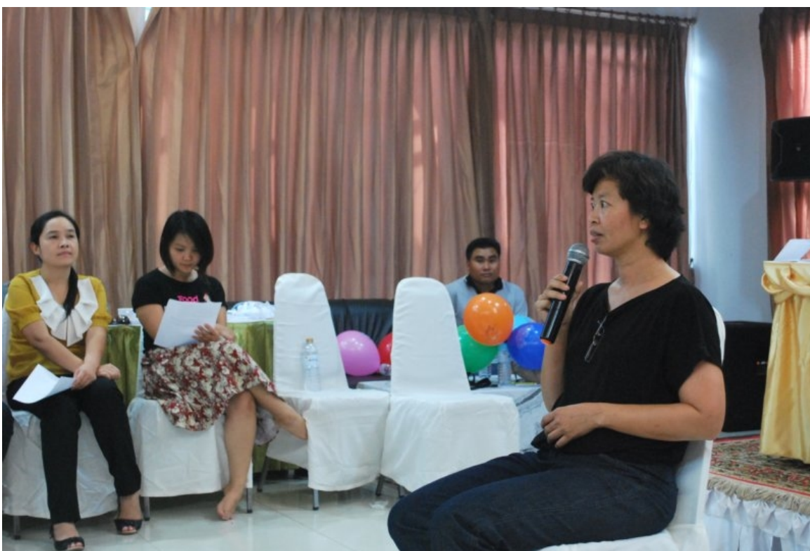
ภาพที่ 10 คณบดีเริ่มสัมมนา “มองอนาคต กำหนดเป้าหมาย”