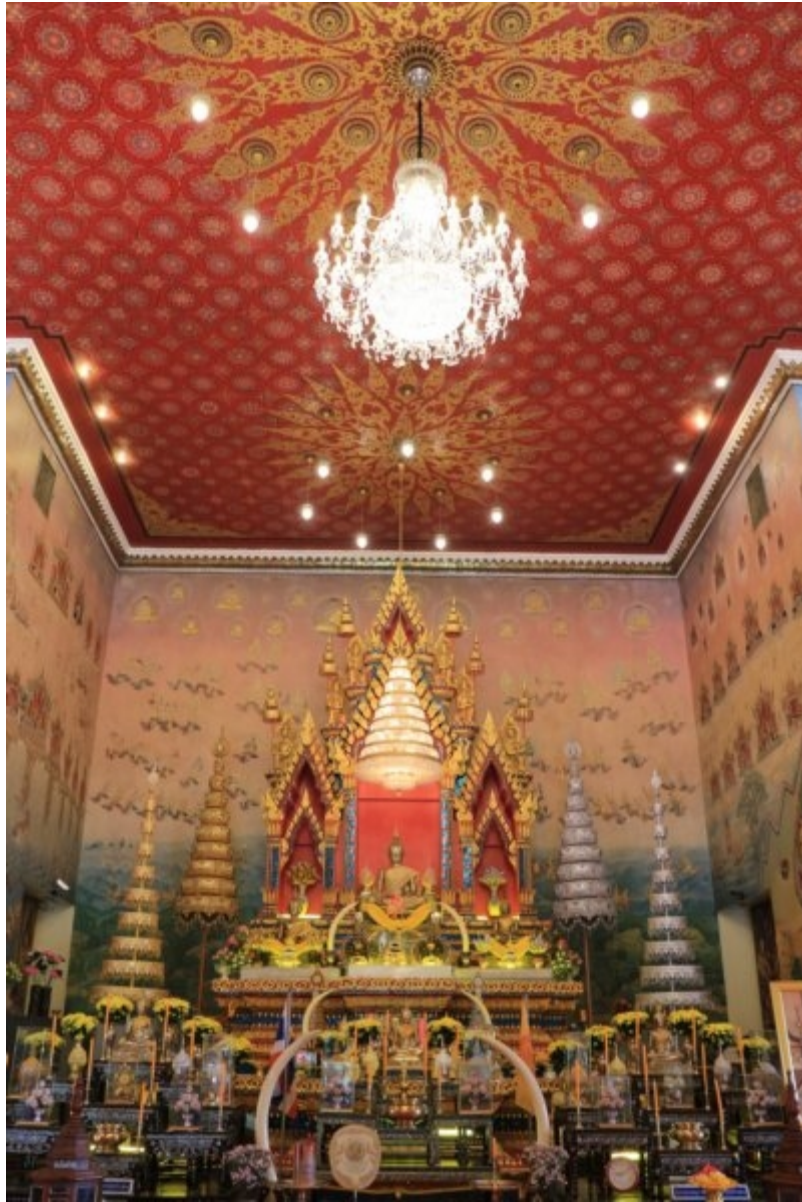
ภาพที่ 13 นมัสการหลวงพ่อดี พระพุทธรูปคูเมืองหนองคาย