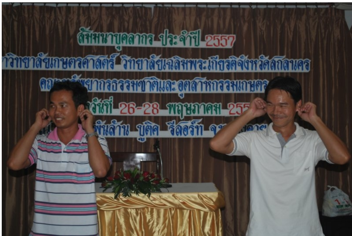
ภาพที่ 5 (บนและล่าง) กิจกรรมละลายพฤติกรรม