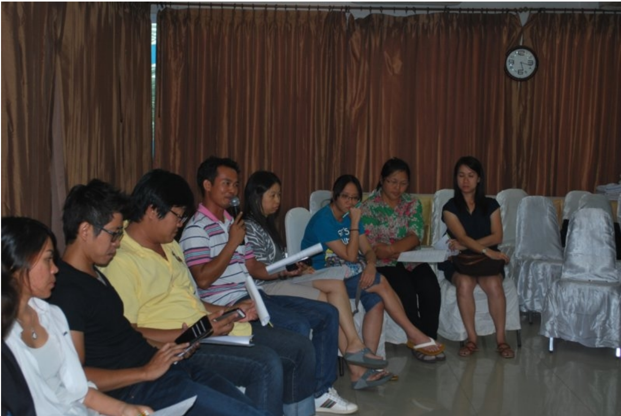
ภาพที่ 11 (บนและล่าง) ร่วมกันแสดงความคิดเห็นในการพัฒนานิสิตให้แข่งขันได้