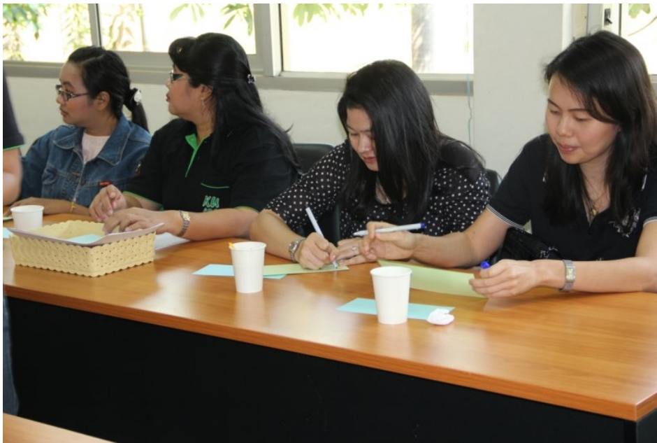
ภาพที่ 2 (บนและล่าง) อาจารย์แต่ละท่านช่วยกันแสดงความคิดเห็น