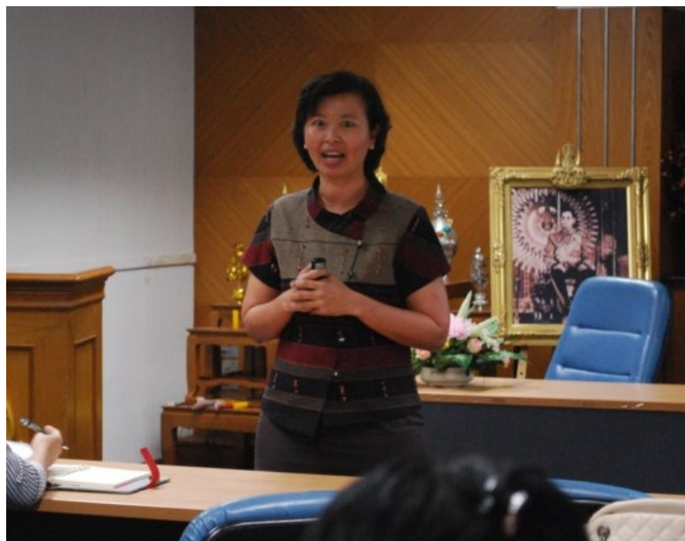
ภาพที่ 1 (บนและล่าง) คณบดีกล่าวเปิดประเด็น