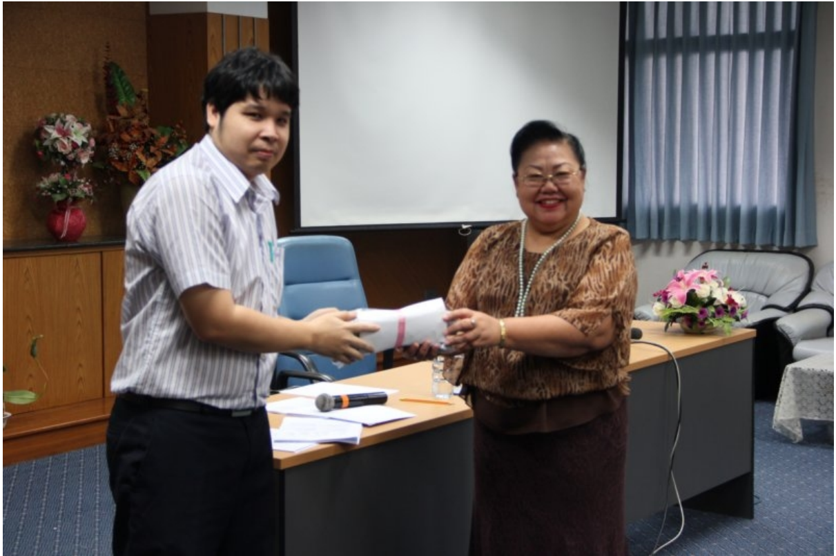
ภาพที่ 10 มอบของที่ระลึกแก่วิทยากร