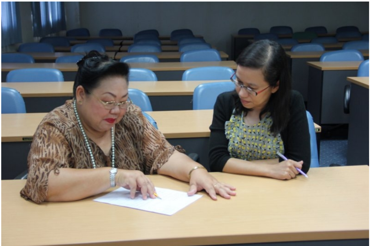
ภาพที่ 9 วิทยากรให้คำปรึกษาเรื่องการเขียนจดหมายเป็นรายบุคคล