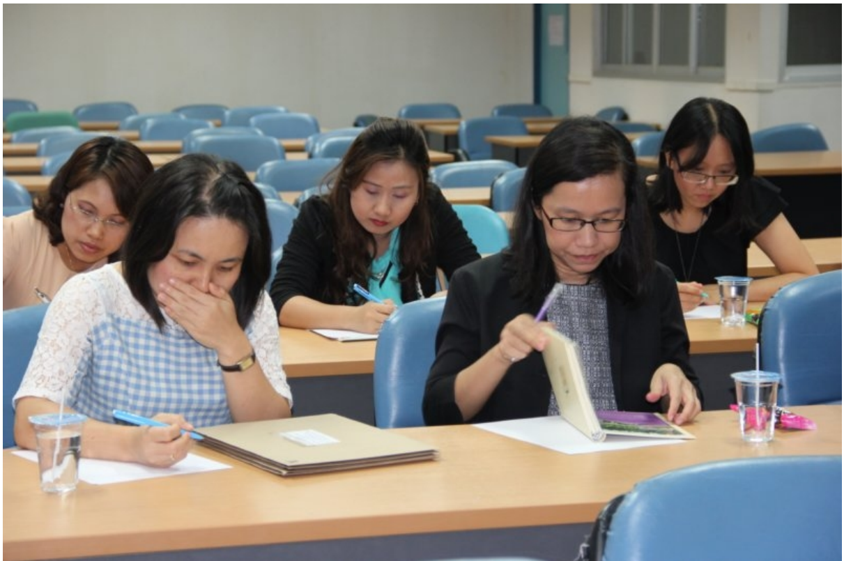
ภาพที่ 4 ผู้เข้าอบรมตั้งใจทำแบบฝึกที่ได้รับมอบหมาย