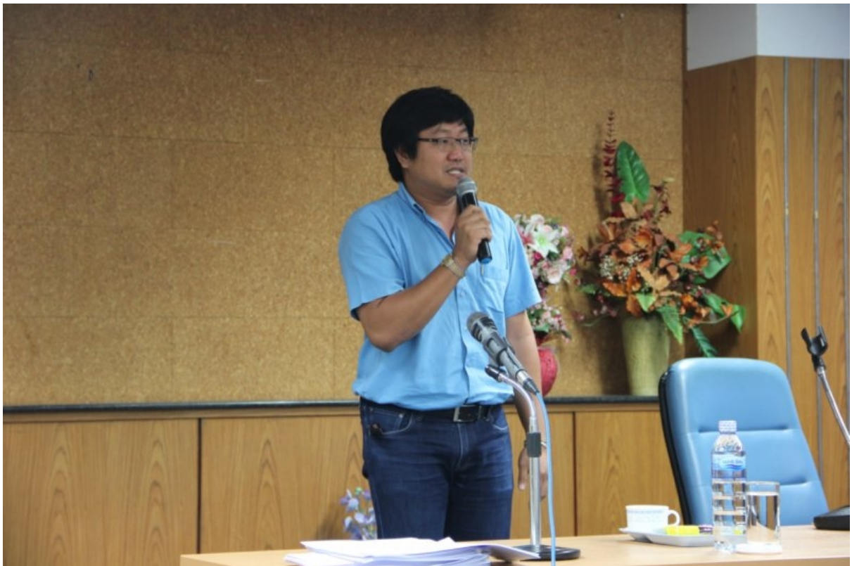
ภาพที่ 7 ฝึกการพูดแนะนำคณะ