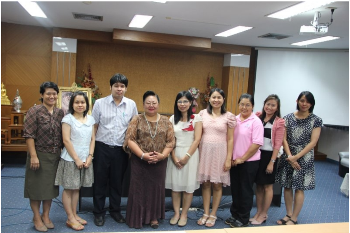
ภาพที่ 10 บันทึกภาพกับวิทยากร