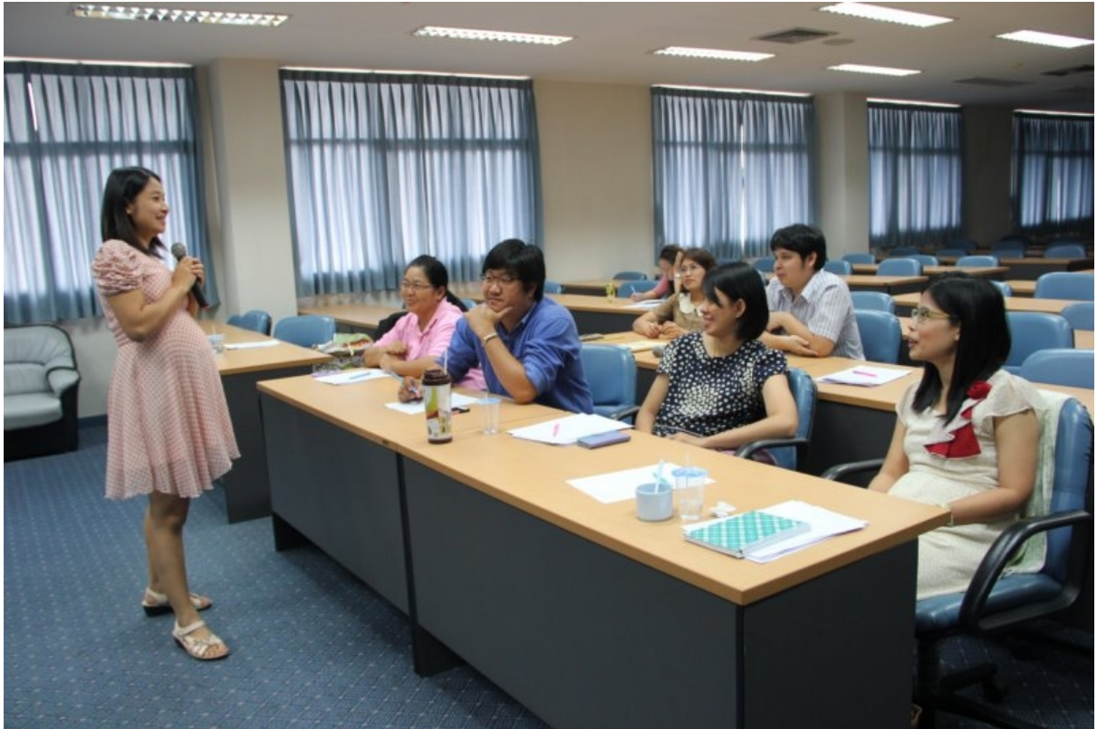
ภาพที่ 8 ฝึกสอนเป็นภาษาอังกฤษ