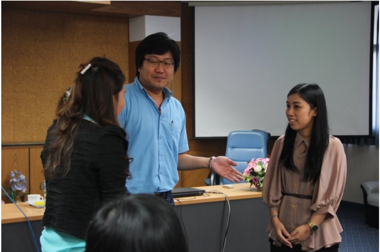
ภาพที่ 6 ฝึกการแนะนำ