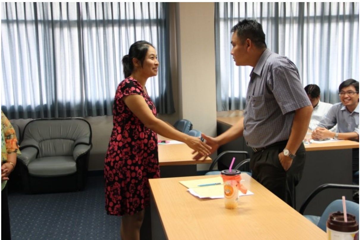
ภาพที่ 5 ฝึกทักทาย