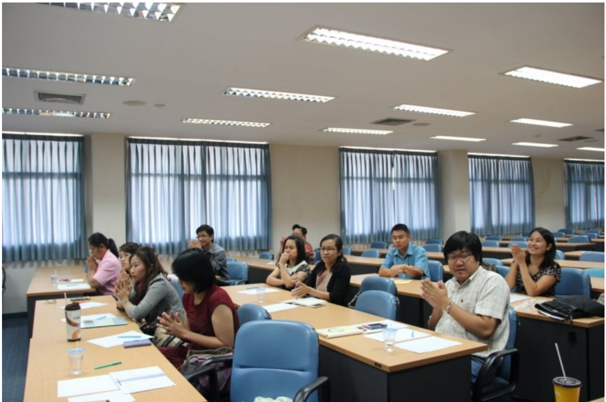
ภาพที่ 3 ผู้เข้าอบรมตั้งใจเรียน