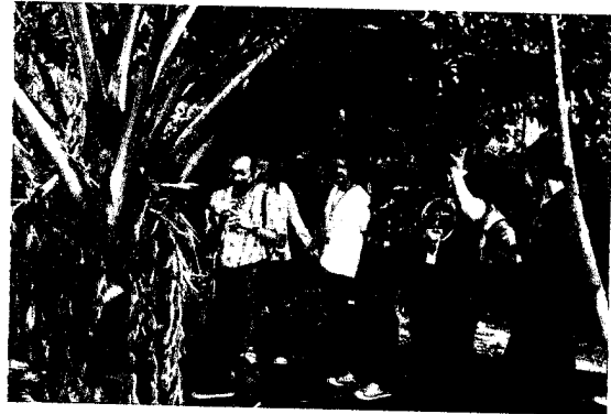
ศูนย์วิจัยพืชสวน จันทบุรี