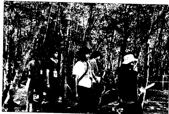
ศูนย์ศึกษาการพัฒนาอ่าวคุ้งกระเบนอันเนื่องมาจากพระราชดำริ