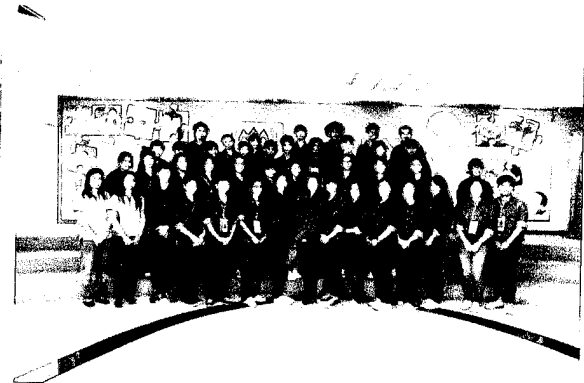
บริษัท เจริญโภคภัณฑ์อาหาร จำกัด (มหาชน) จ.นครราชสีมา