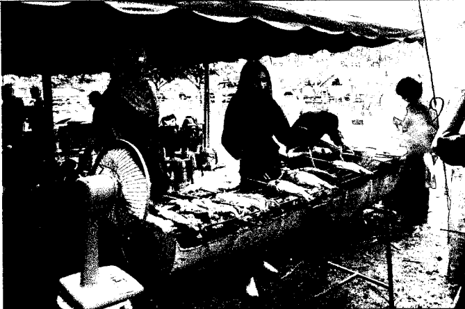
ชุมชนสัตวศาสตร์