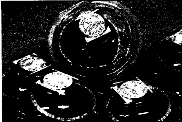
ผลิตภัณฑ์ชุมชนเทคโนโลยีการอาหาร