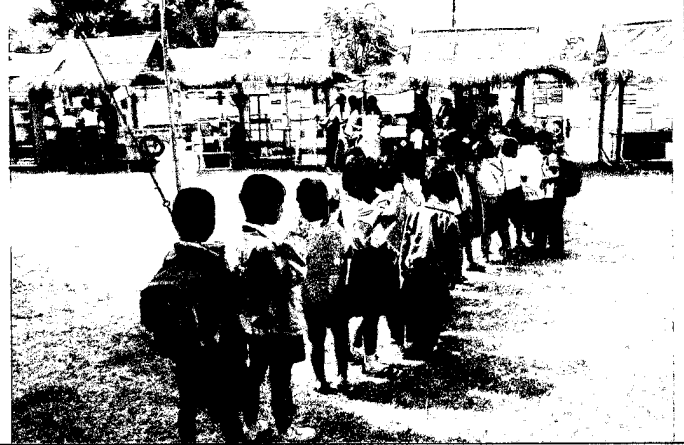
เด็กนักเรียนเข้าแถวรับไอศกรีม