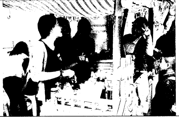
ชุมชนเทคโนโลยีการอาหาร