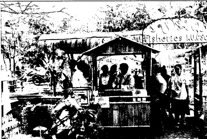
ชุมชนประมง