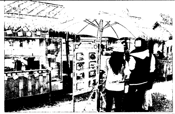
ชุมชนพืชศาสตร์