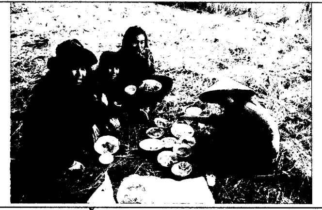
เสร็จสิ้นกิจกรรมรับประทานอาหารร่วมกัน