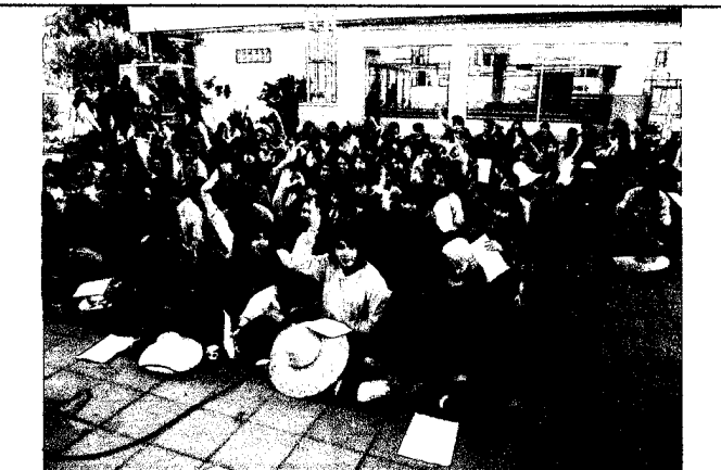
ให้นิสิตทำแบบประเมินโครงการ