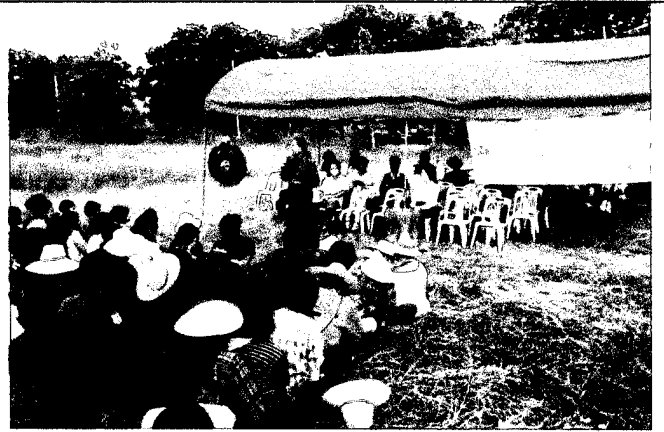
พิธีเปิดโครงการ