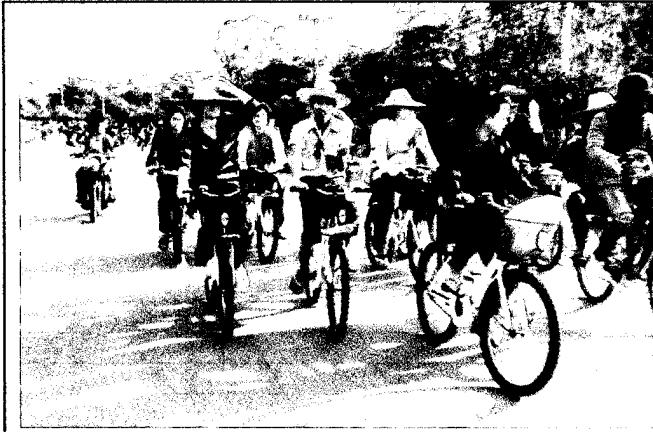
นิสิตเดินทางเข้าร่วมโครงการโดยจักรยาน