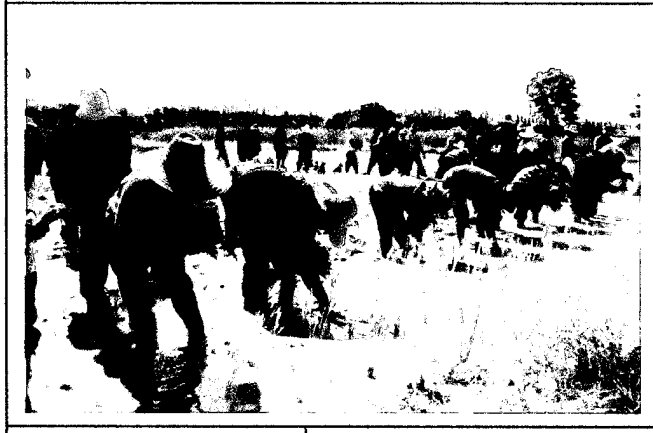
เริ่มดำนา