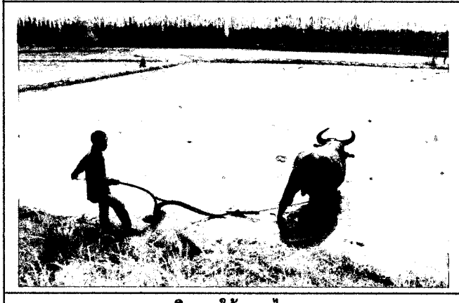
สาธิตการใช้ควายไถนา