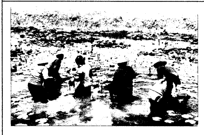
กิจกรรมบำเพ็ญประโยชน์ ในช่วงบ่าย