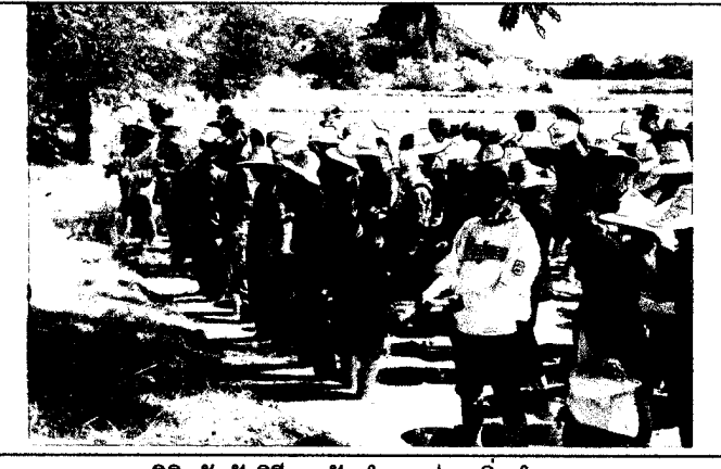
นิสิตรับฟังวิธีการปักดำนา ก่อนเริ่มดำนา