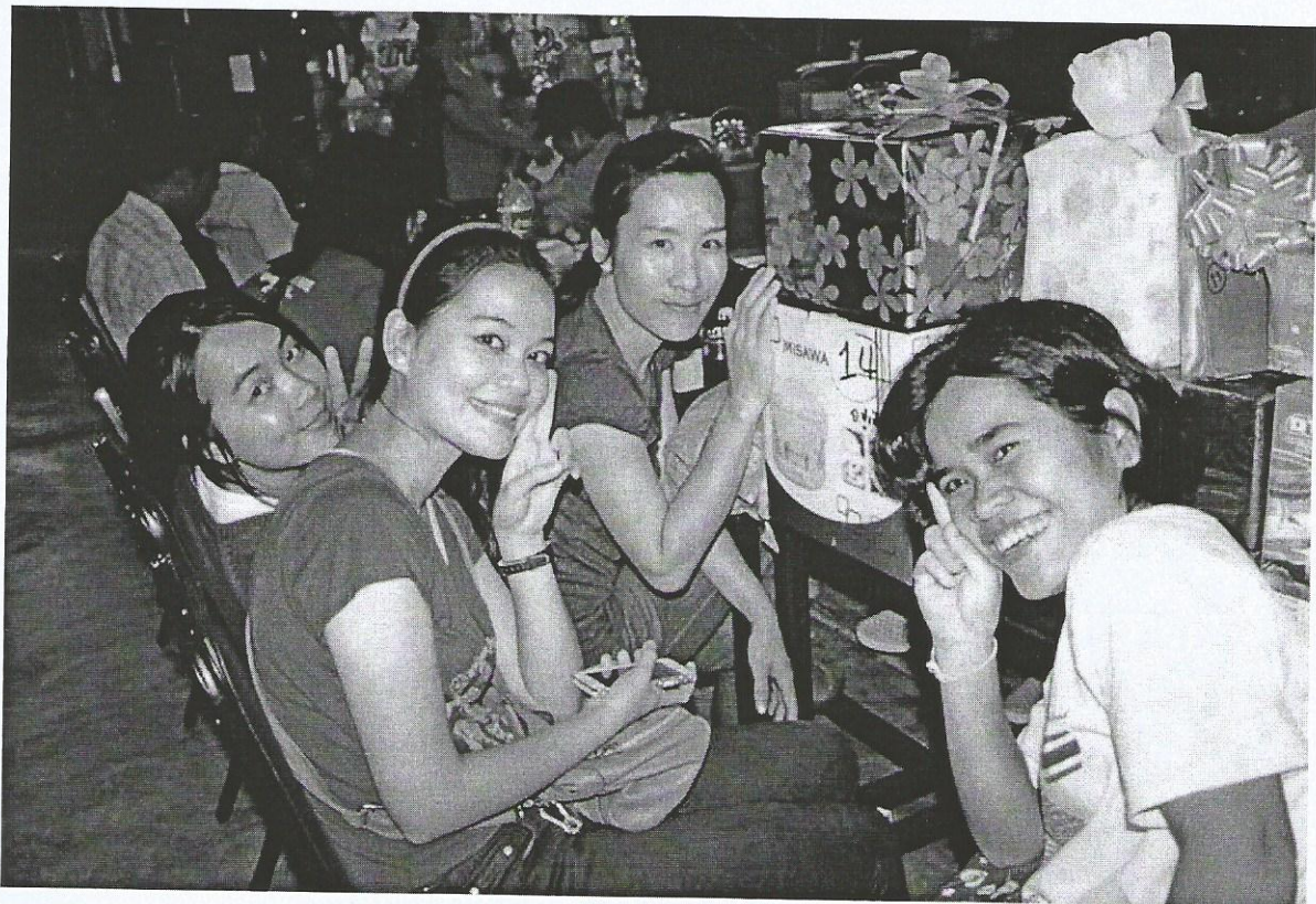
ภาพที่ 10 (บนและล่าง) รอยยิ้มของบรรดาลูกหลานและบุคลากรในคณะ