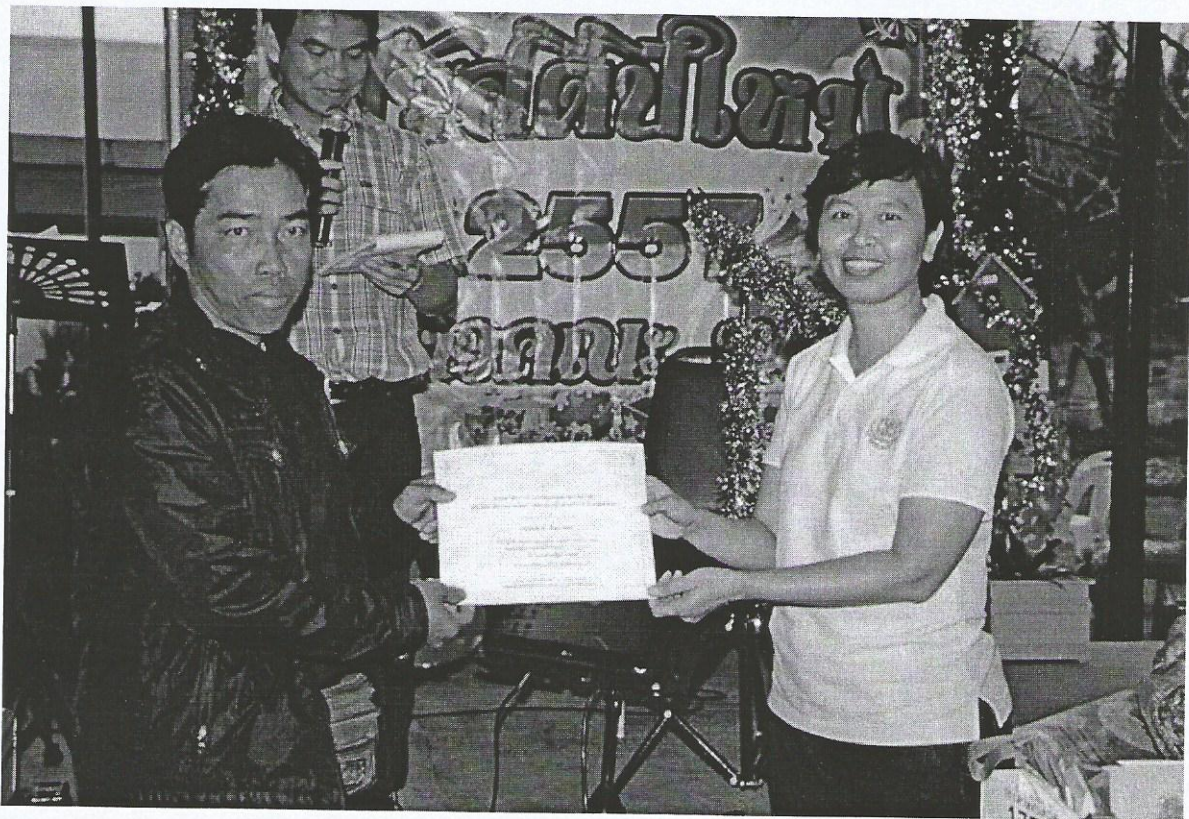
ภาพที่ 8 (บนและล่าง) มอบประกาศเกียรติคุณแก่บุคลากรดีเด่น ประจำปี 2556 (ต่อ)