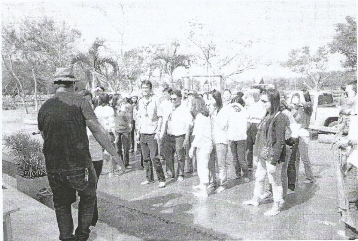
ภาพที่ 2 (บนและล่าง) แบ่งสี่เตรียมตัวแข่ง