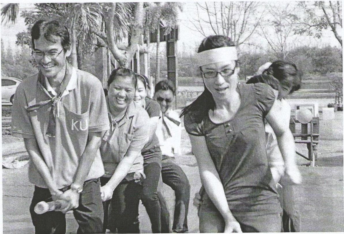
ภาพที่ 4 (บนและล่าง) รถไฟจะไปแทงโป่ง