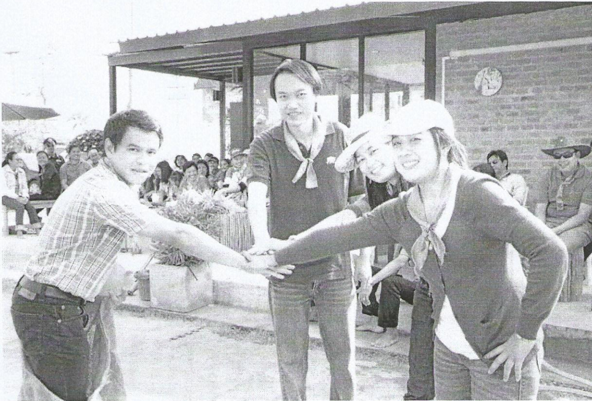
ภาพที่ 5 พร้อมสู้