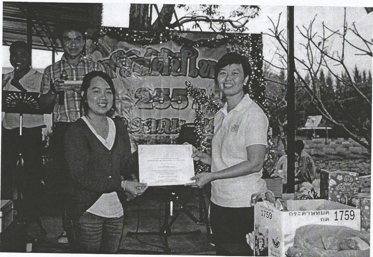
ภาพที่ 7 (บนและล่าง) มอบประกาศเกียรติคุณแก่บุคลากรดีเด่น ประจำปี 2556