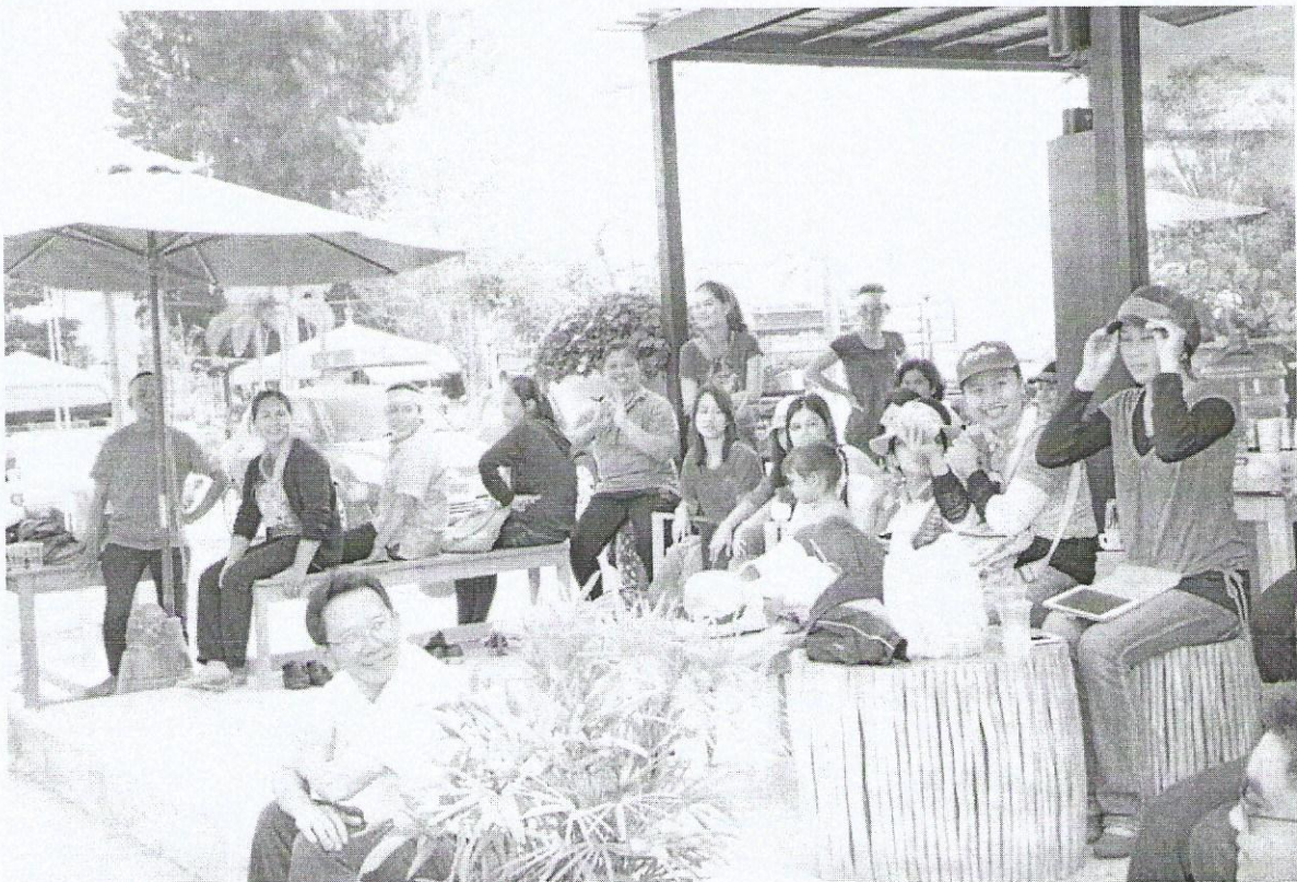
ภาพที่ 1 (บนและล่าง) check in ผู้เข้าร่วมกิจกรรม