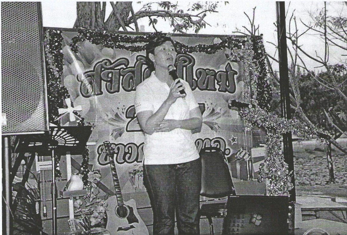
ภาพที่ 6 กล่าวขอบคุณบุคลากรโดยคณบดี คณะ ทอ.