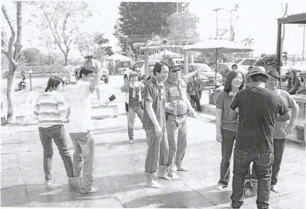
ภาพที่ 3 (บนและล่าง) แข่งแชร์บอล 3 ขา