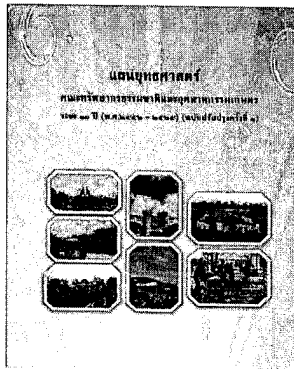
แผนยุทธศาสตร์ 10 ปี (พ.ศ.2556-2565) ฉบับปรับปรุง ครั้งที่ 1