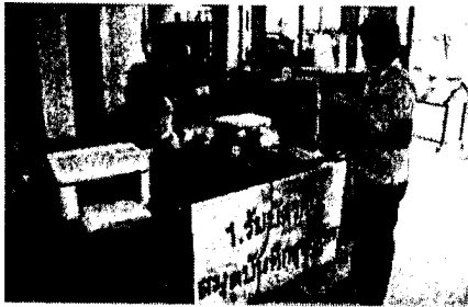
จุดบริการที่ ๑ รับบัตรคิว/สมุดบันทึกสุขภาพ