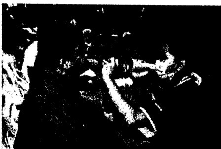
จุดบริการที่ ๘ ตรวจสุขภาพช่องปาก