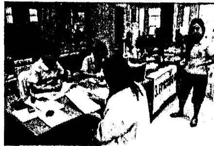
จุดบริการที่ ๔ แจกรายการตรวจสุขภาพ/ตรวจเพิ่ม