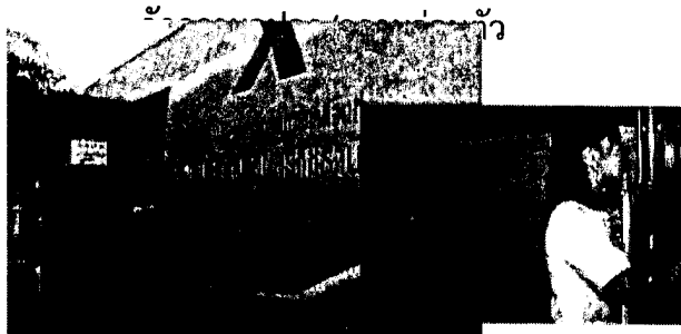
จุดบริการที่ ๙ เอ็กซเรย์ปอด X - Ray