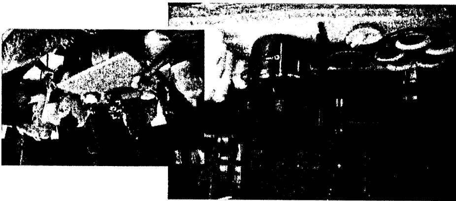
ក្រុង ភ្នំពេញ រាជធានី ភ្នំពេញ

(២៤៥៥ លេខ ៧៧ ក្រុង ភ្នំពេញ រាជធានី ភ្នំពេញ) ២៤៥៥ លេខ ៧៧ ក្រុង ភ្នំពេញ រាជធានី ភ្នំពេញ ២៤៥៥ លេខ ៧៧ ក្រុង ភ្នំពេញ រាជធានី ភ្នំពេញ