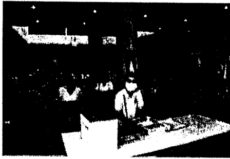
รับแบบฟอร์ม