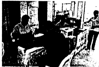
จุดบริการที่ ๒ ลงทะเบียนและออกเลข H/N