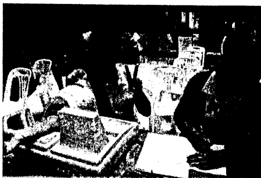
จุดบริการที่ ๕ ชั่งน้ำหนัก วัดความดันโลหิต