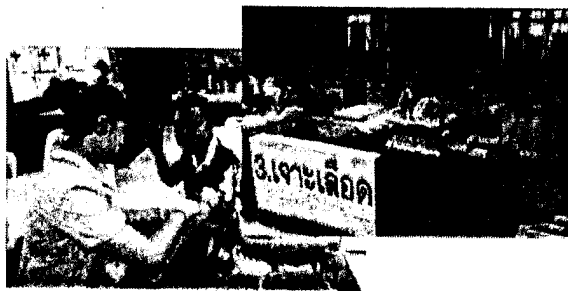
จุดบริการที่ ๓ เจาะเลือด