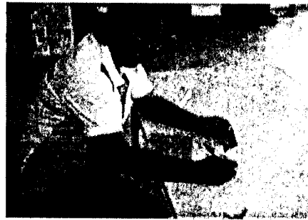
กรอกประวัติ