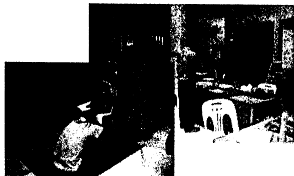
จุดบริการที่ ๖ และ ๗ ทดสอบสมรรถภาพทางกาย