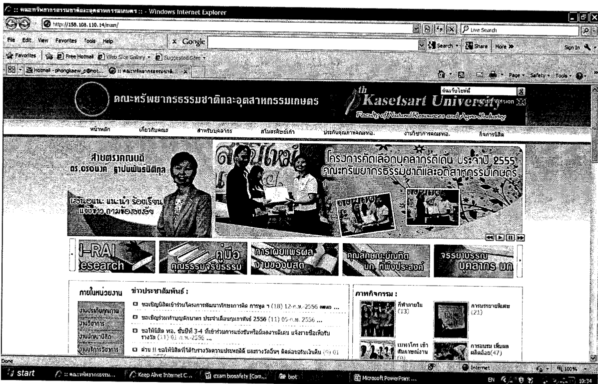
ภาพที่ 1 แสดงส่วนของหน้าเว็บไซต์คณะ ทอ. ในการเผยแพร่บุคลากรที่ได้รับรางวัล