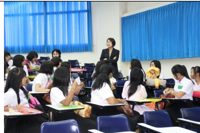
อาจารย์พบนิสิตในที่ปรึกษา