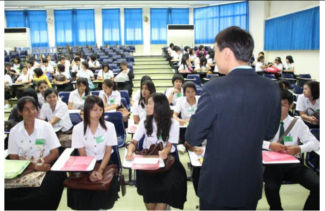
อาจารย์พบนิสิตในที่ปรึกษา