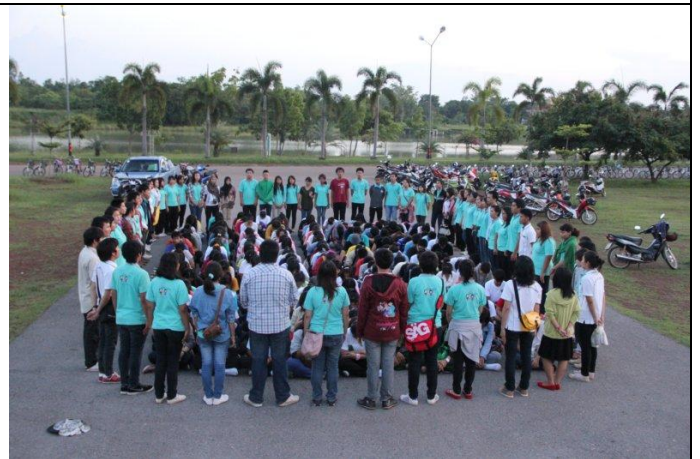
ทางคณะฯ จัดให้มีระบบพี่น้องสายรหัส