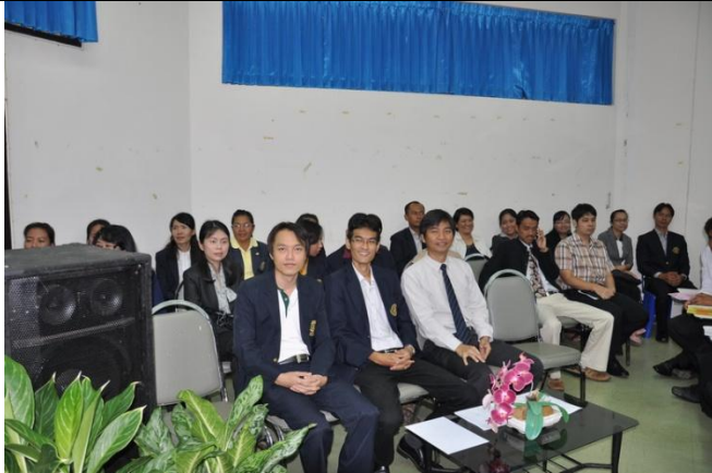
คณาจารย์เข้าร่วมโครงการ