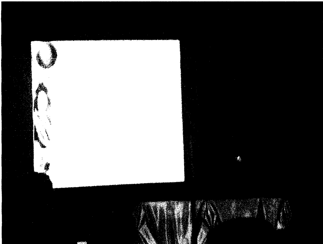
ภาพที่ 4 การนำเสนอผลงานภาคบรรยาย