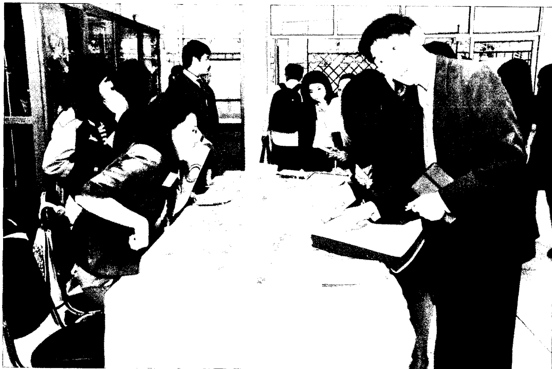
ภาพที่ 2 ลงทะเบียนเข้าร่วมงานประชุมฯ