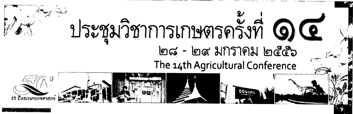
ภาพที่ 1 ป้ายการประชุมวิชาการเกษตรครั้งที่ 14

การเข้าร่วม และนำเสนอผลงานภาคบรรยายในการประชุมวิชาการเกษตรครั้งที่ 14