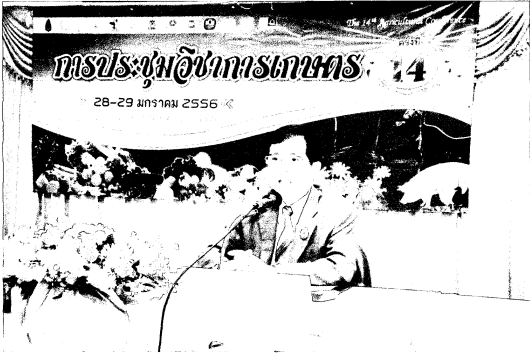
ภาพที่ 3 ประธานกล่าวเปิดงาน