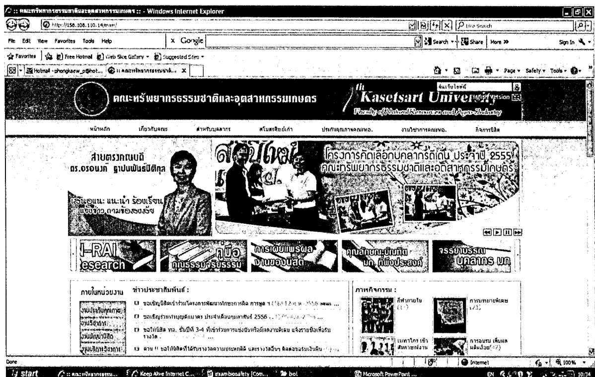
ภาพที่ 1 แสดงส่วนของหน้าเว็บไซต์คณะ ทอ. ในการเผยแพร่บุคลากรที่ได้รับรางวัล