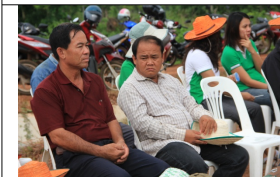
ในพิธีเปิดกิจกรรมมีเจ้าหน้าที่หน่วยงานภายนอกเข้าร่วม