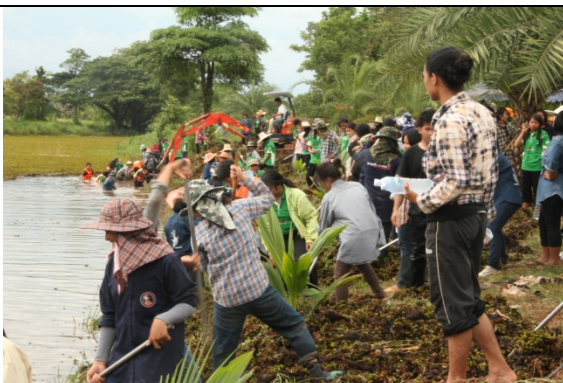
ช่วงบ่าย กิจกรรมพัฒนาวิทยาเขต