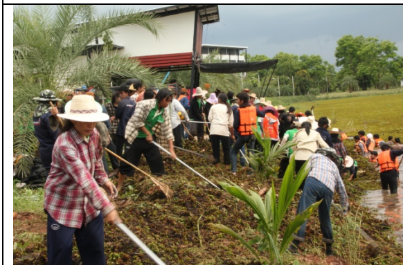
ช่วงบ่าย กิจกรรมพัฒนาวิทยาเขต