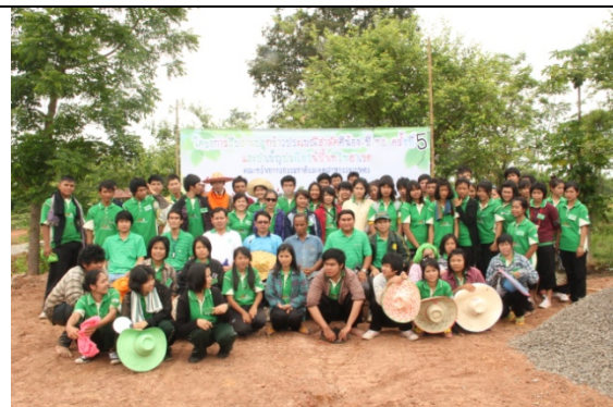
ร่วมถ่ายภาพหมู่เป็นที่ระลึก