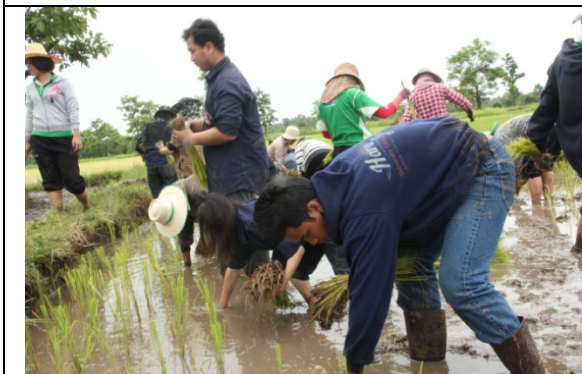
กิจกรรมดำนา