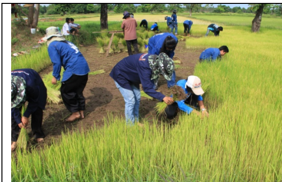
นิสิตช่วยตั้งแต่กิจกรรมการถอนต้นกล้า

(สามารถชมเพิ่มเติมได้ที่ http://158.108.110.14/~gallery/activity/55_takerice/ )