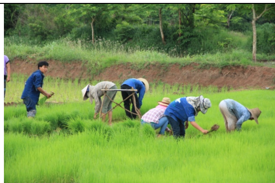
นิสิตกำลังช่วยกันถอนต้นกล้า