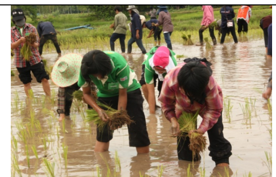
กิจกรรมดำนา