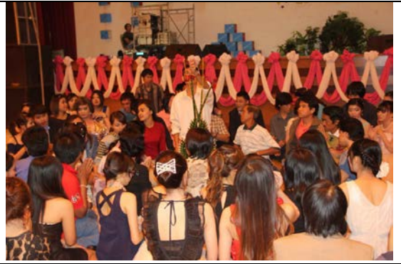
พิธีบายศรีสู่ขวัญ