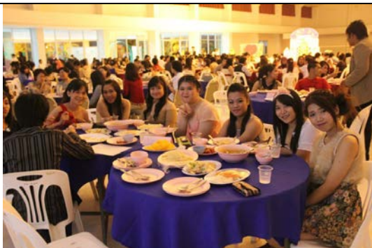
รับประทานอาหาร