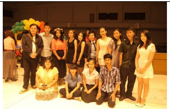
นิสิตถ่ายภาพหมู่สายรหัส

เพิ่มเติมได้ที่ http://158.108.110.14/~gallery/activity/56_bynior/index2.html