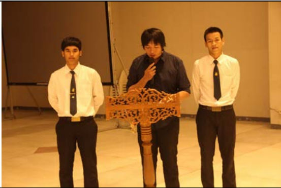
ประธานโครงการกล่าวเปิดงาน