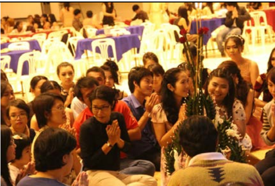
พิธีบายศรีสู่ขวัญ