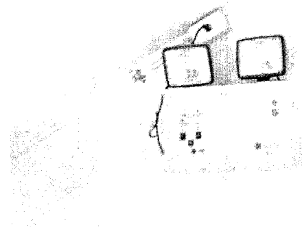
จุดส่งน้ำเมื่อเกิดเหตุเพลิงไหม้ภายนอกอาคาร และไฟฉุกเฉินในอาคารเมื่อเกิดเหตุ