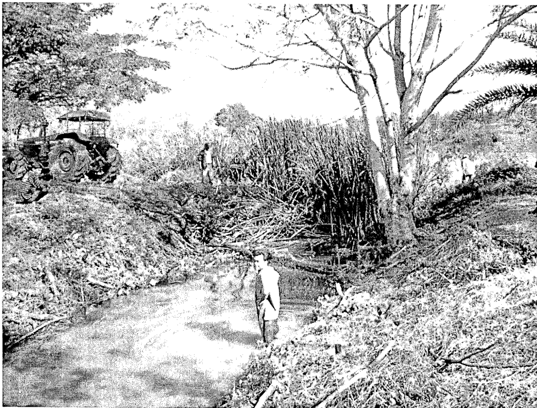
การกำจัดขุดลอกวัชพืชตามอ่างและร่องระบายน้ำ