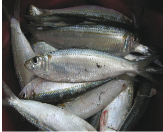
ภาพที่ 4 ปลาหลังเขียว ( Sardinella sp.) สัตว์น้ำเศรษฐกิจชนิดใหม่ที่สำรวจพบบริเวณป่าชายเลนจังหวัดระนอง หลังเกิดคลื่นสึนามิ

และปลาหลังเขียว ( Sardinella sp.) (ภาพที่ 4) มีจำนวนเพิ่มขึ้น เมื่อเปรียบเทียบจำนวนชนิดและปริมาณของสัตว์น้ำเศรษฐกิจในแต่ละพื้นที่ปรากฏว่า บริเวณป่าชายเลนหวางซึ่งเป็นป่าชายเลนที่สมบูรณ์และเป็นพื้นที่สงวนชีวมณฑล (biosphere reserve) ไม่ได้รับผลกระทบจากคลื่นสึนามิ พบจำนวนชนิดของสัตว์น้ำเศรษฐกิจสูงที่สุด (13 ชนิด) ส่วนบริเวณป่าชายเลนบางเบนและทะเลนอกซึ่งได้รับผลกระทบจากคลื่นสึนามิอย่างรุนแรงพบจำนวนชนิดของสัตว์น้ำเศรษฐกิจน้อยที่สุด (4 และ 6 ชนิด ตามลำดับ) จากข้อมูลดังกล่าวทำให้เชื่อได้ว่านอกจากคลื่นสึนามิได้สร้างความเสียหายแก่ชีวิตและทรัพย์สินของราษฎรแล้วยังส่งผลกระทบต่อระบบนิเวศป่าชายเลน คือ ทำลายแหล่งที่อยู่อาศัยและแหล่งอนุบาลของสัตว์น้ำ ทำให้เกิดการสูญเสียความหลากหลายทางชีวภาพด้านชนิดของสัตว์น้ำเศรษฐกิจ