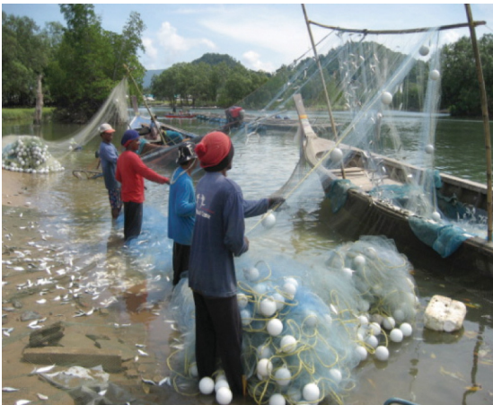
ภาพที่ 5 ชาวประมงที่เป็นผู้ชายจะทำหน้าที่ออกเรือและทำการประมงด้วยอวนลอยเพื่อจับปลาหลังเขียวและเก็บรวบรวม (ผู้หญิงจะทำหน้าที่ส่งขายตลาดในชุมชนและทำแปรรูปเป็นผลิตภัณฑ์ประมง เช่น ปลาหวานแห้งโรยงา)

จากการสำรวจพบว่ามีปลาหลังเขียวในบริเวณป่าชายเลนและแนวชายฝั่งทะเลจำนวนมากหลังเกิดคลื่นสึนามิ ชาวประมงสามารถจับปลาชนิดนี้ด้วยเรือประมงขนาดเล็ก และเครื่องมือจับสัตว์น้ำแบบพื้นบ้าน (ภาพที่ 5) ซึ่งแต่เดิมต้องใช้เรือประมงขนาดใหญ่ออกไปจับด้วยอวนล้อมนอกชายฝั่งทะเล สาเหตุที่สำรวจพบปลาหลังเขียวบริเวณป่าชายเลนหลังเกิดคลื่นสึนามิในปริมาณมากอาจเนื่องมาจากเหตุผล 4 ประการดังนี้