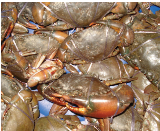
ภาพที่ 3 ปูทะเล ( Scylla olivacea ) สัตว์น้ำเศรษฐกิจที่สำรวจพบบริเวณป่าชายเลนจังหวัดระนองทั้งก่อนและหลังเกิดคลื่นสึนามิ

ปลาหลังเขียว ( Sardinella sp.) ปูทะเล ( Scylla olivacea ) กุ้งแช่เป็วย ( Penaeus merguensis ) กุ้งเคย ( Acetes sibogace ) และปลาทราย ( Sillago sp.) เป็นกลุ่มสัตว์น้ำเศรษฐกิจที่พบปริมาณมากที่สุดและกระจายอยู่ทั่วไปทั้งในพื้นที่ที่ได้รับและไม่ได้รับผลกระทบจากคลื่นสึนามิ เป็นที่น่าสังเกตปลาหลังเขียวเพิ่มจำนวนขึ้นอย่างมากในป่าชายเลนหลังจากเกิดคลื่นสึนามิ ซึ่งก่อนเกิดคลื่นสึนามิไม่มีรายงานสำรวจพบมาก่อน (Macintosh et al., 2002) ชาวประมงพื้นบ้านสามารถจับปลาหลังเขียวได้ด้วยเครื่องมือจับปลาแบบพื้นบ้าน ทำให้ชีวิตความเป็นอยู่ของชาวประมงดีขึ้น มีอาหาร มีอาชีพ และมีรายได้เพิ่มขึ้นจากการจับและแปรรูปปลาหลังเขียวเพื่อจำหน่าย